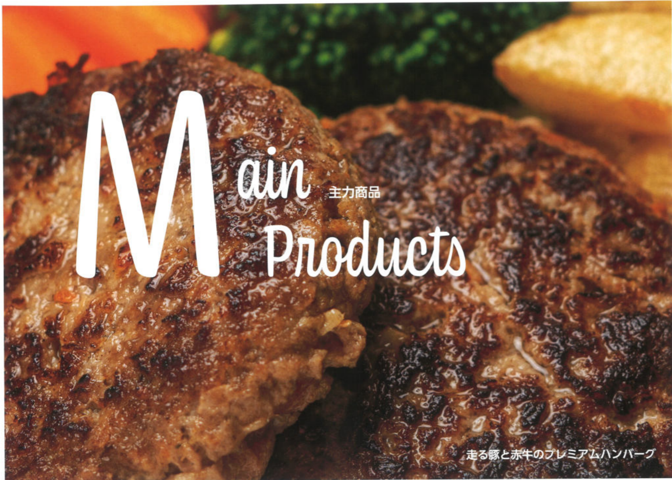
走る豚と赤牛のプレミアムハンバーグ