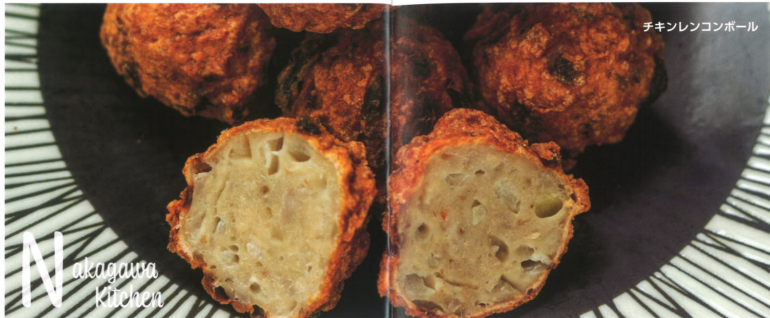
チキンレンコンボール